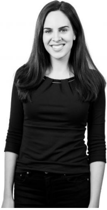
Fabienne Hunziker Bildungszentrum